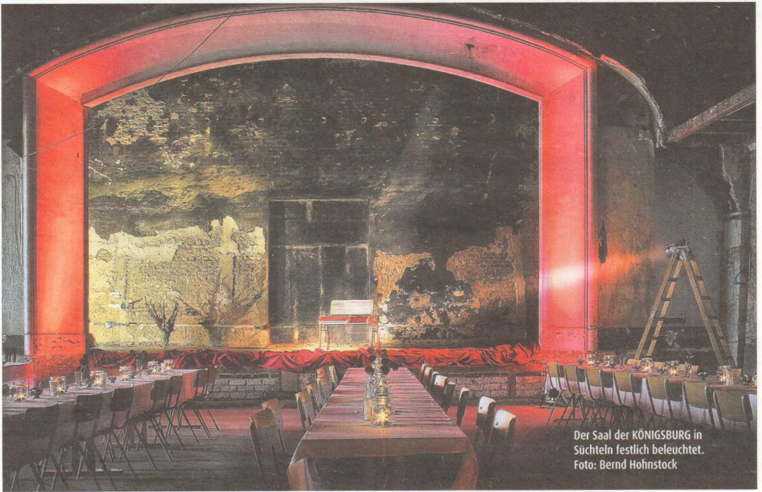
Der Saal der KÖNIGSBURG in Süchteln festlich beleuchtet.