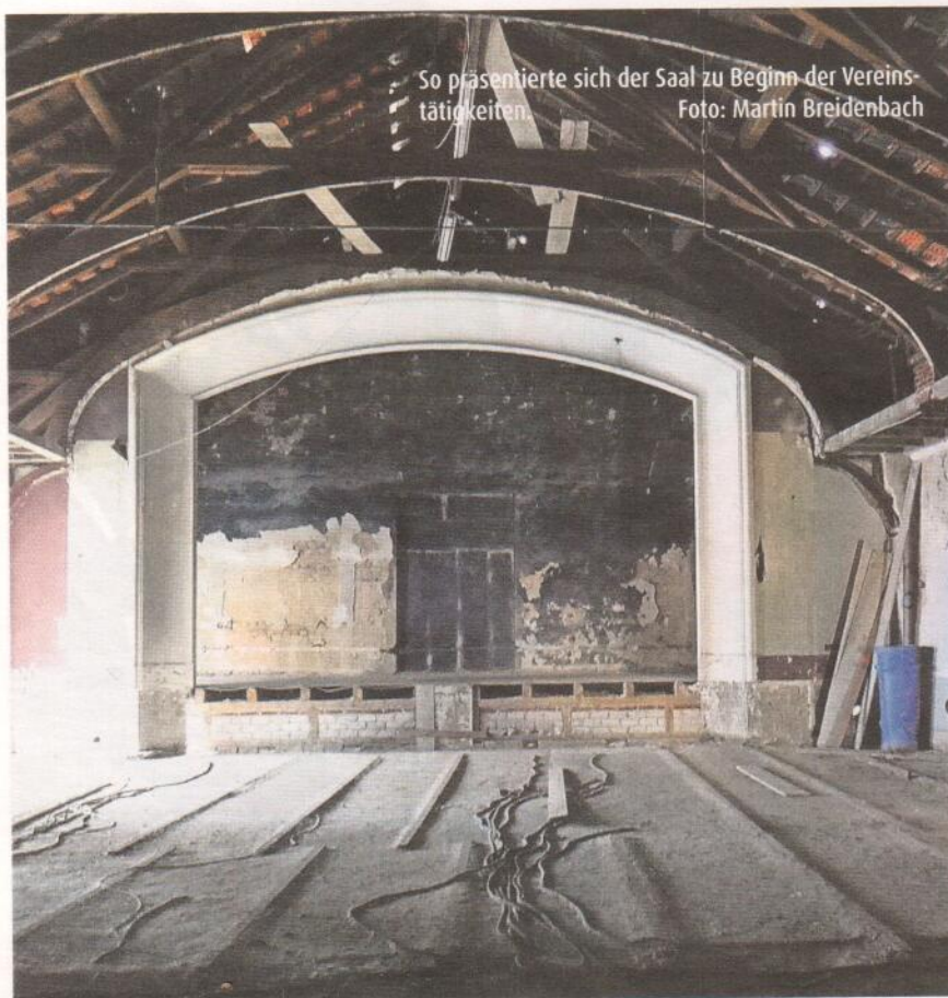
So präsentierte sich der Saal zu Beginn der Vereinstätigkeiten.

► KÖNIGSBURG-Kalender 15 Euro Verkaufsstellen in Süchteln: Volksbank Reisebüro Holiday-Land Schreibwaren Kerpers Verkaufsstellen in Viersen: Buchhandlung im Kaisereck und bei den nächsten Kinoabenden