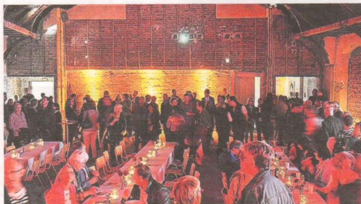
Am Tag des offenen Denkmals kamen über 1.500 Besucher in die KÖNIGSBURG.